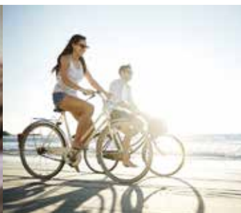
Location de vélos