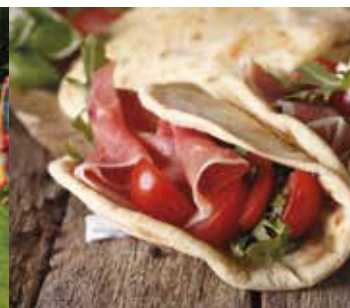
Restaurants et typicités