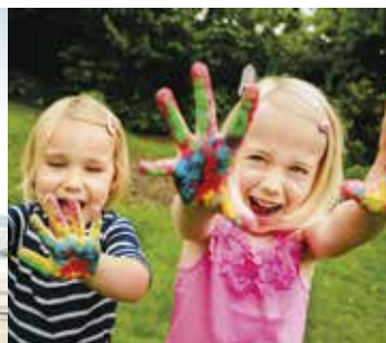
Animation et Mini-club